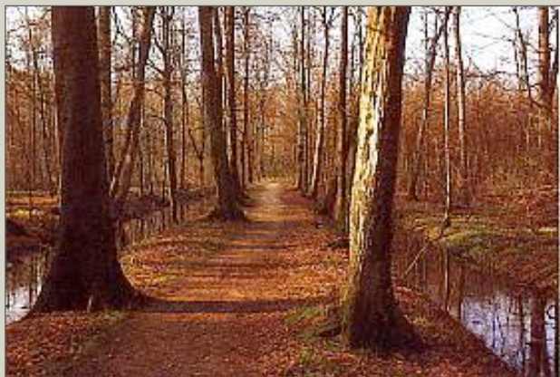
Ein „Inselgraben“ der Hannoverschen Landwehr

Die Landwehren bestanden im wesentlichen aus Hecken, Wällen, Fluss-/Bachläufen, Gräben und Knicken. Die Knicke wurden zum Teil aus Dornenhecken gebildet, deren Triebe man geknickt hat und die dennoch weiterwachsen. So bildeten sie im Laufe der Zeit einen schwer zu überwindenden Schutzwall. Heute sind davon nur noch einige Wälle, Gräben und die Warttürme zu sehen. Die „Hohe Landwehr“ bestand aus Dornenhecken und Gräben, die sich heute noch nachweisen lassen. Einer von ihnen führt heute noch sein Wasser in die Leine. Man vermutet, dass die Ansammlung von Dornenhecken Dorf Döhren seinen Namen gaben, denn der mittelalterliche Name lautete „Thurniti“, getrennt in „Thurn“ (Dorne) und „iti“ (Ort/Stelle), hat sich der Name über verschiedene Schreibweisen zu Döhren verschliffen. Die „Döhrener Warte“ wurde bereits 1355 erwähnt. 1382 ist als Fertigstellungsdatum des Döhrener Turms bekannt. Der Döhrener Turm wurde 1486 bei einem Angriff des Herzogs Heinrich d.Ä. verbrannt. Es sollen die Turmwächter ums Leben gekommen sein, danach entstand die Sage von den Hannoverschen Spartanern. 1488 war der Turm wieder vollständig instandgesetzt.