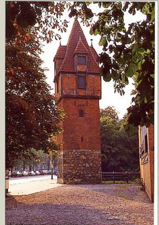
Der Pferdeturm, ein spätmittelalterlicher Wartturm, dem ein Gasthaus angegliedert war.

Eine heute noch gut sichtbare Warte ist der 1387 als „Hardenbergstorn“ genannte Pferdeturm. Im Gegensatz zum Döhrener Turm hat er einen quadratischen Grundriss